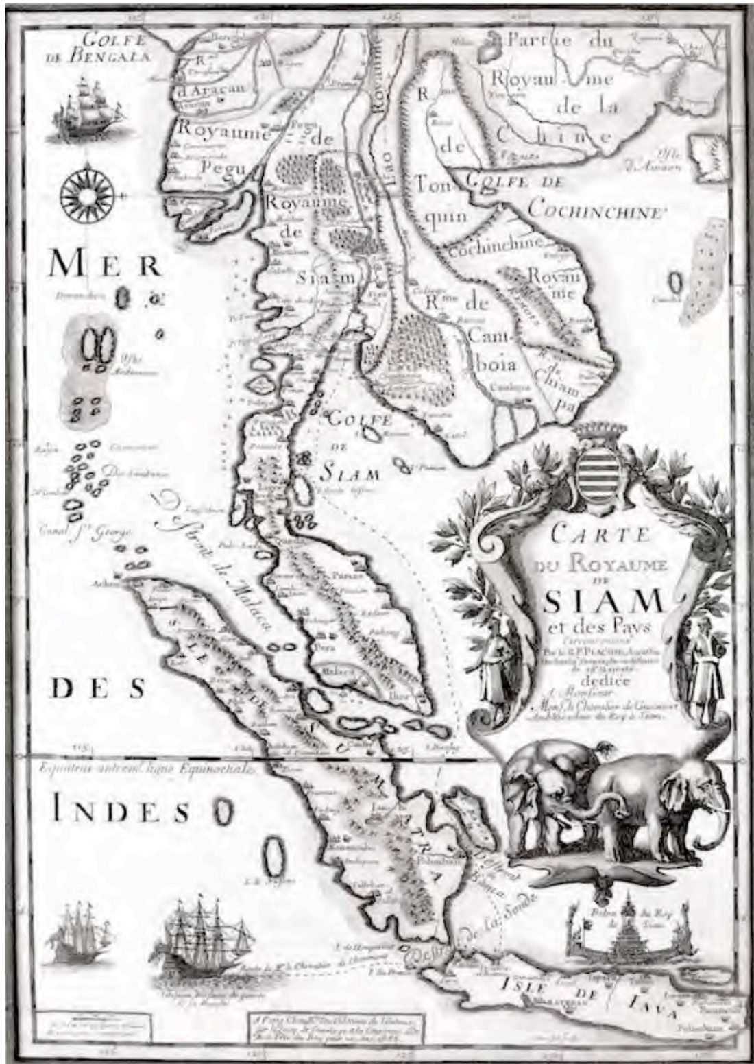
Bản đồ Champa vào năm 1686 của ông R. P. Placide (Pháp)