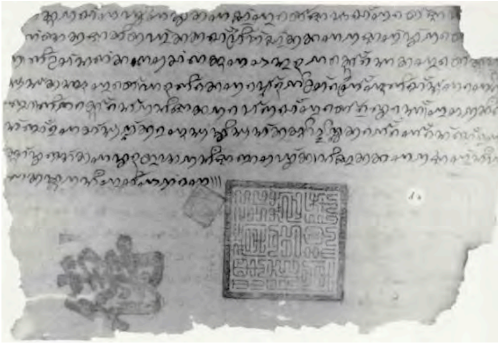
Tư liệu hoàng gia Champa (1702-1810) có dấu mộc của nhà Nguyễn